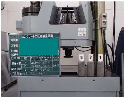
コンクリート試験

『JNLA標章』が付いた試験報告書を発行することができます。 ISO9000シリーズでは、事業所の品質システムが認証登録されますが、 製品そのものの品質を保証するものではありません。 これに対してISO/IEC17025は、試験結果そのものを第三者機関が保証するものです。