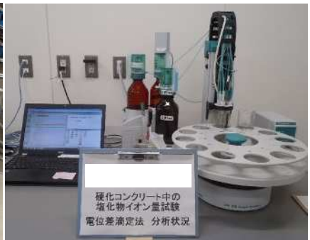
塩化物イオン量試験